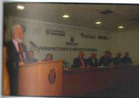
Comunidades municipais e estaduais ouvem o secretário-geral do BIE.