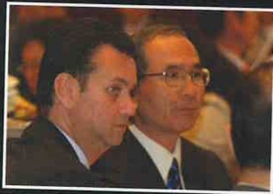
O Prefeito, em evento com o Cônsul-Geral do Japão.