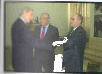
Cotait fala ao Prefeito de Lisboa e ao Cônsul-Geral de Portugal