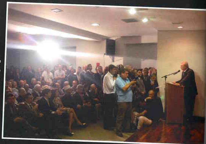
Primeiro discurso como secretário.