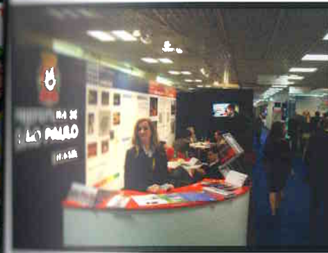
Prefeito em São Paulo no MIPIM 2010.