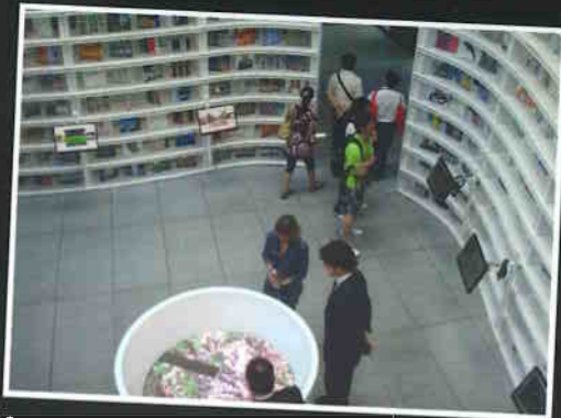
Stand de São Paulo na Expo 2010.