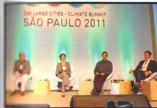
Secretário do Verde e Meio Ambiente em painel do C40.