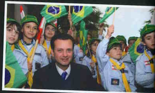
Prefeito é recebido por crianças no interior do Líbano.