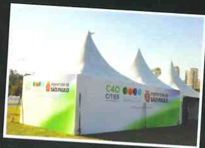
Parque do Ibirapuera preparado para recepcionar C40.