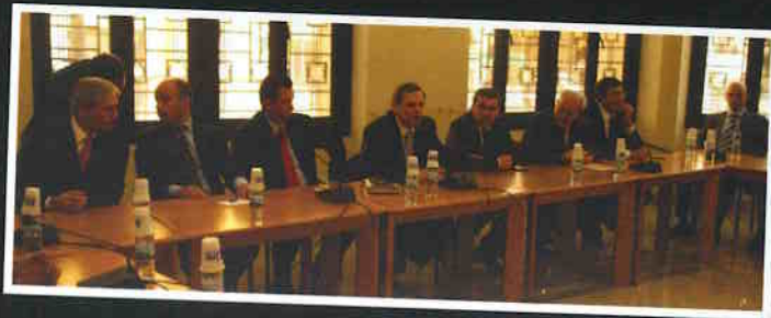
Reunião com parlamentares libaneses em Beirute.