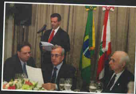
Almoço oferecido ao Presidente do Líbano.