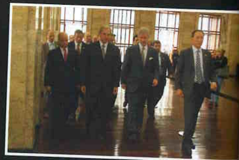
Príncipe da Bélgica chega à sede da Prefeitura.