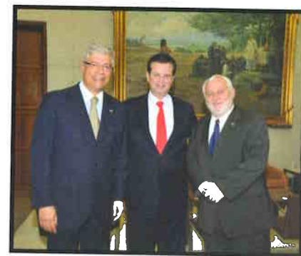
Visita de ministro de Estado da Hungria.