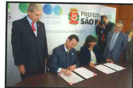
Assinatura de acordo com a Vice-Prefeita de Paris.