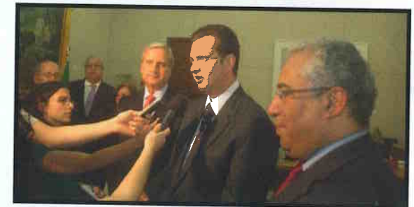
Recepção ao Prefeito de Lisboa.