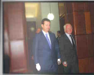
Prefeito recebe o presidente da região francesa PACA.