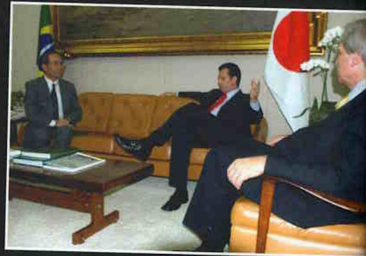
Visita do Cônsul-Geral do Japão