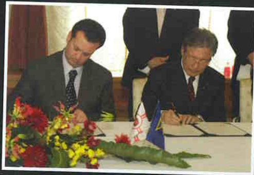
Prefeito Gilberto Kassab recebe delegação de Osaka, Japão, na ocasião 40º aniversário do acordo de Cidades-Irmãs.