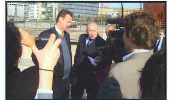
Visita a Lyon, com o prefeito da cidade francesa.