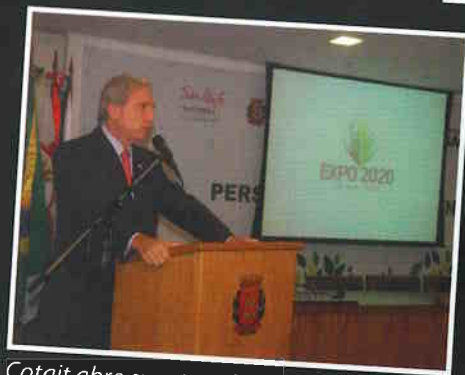
Cotait abre evento sobre a candidatura à Expo 2020.