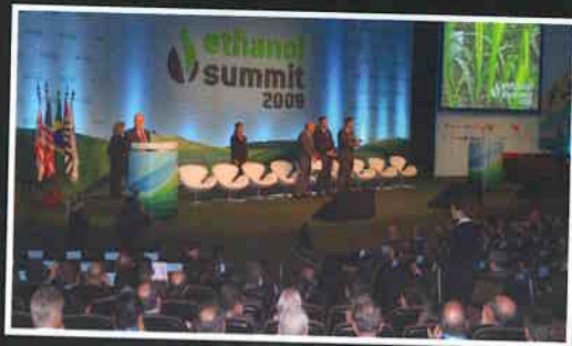
2ª edição do Ethanol Summit.