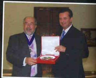
Recebendo Lord Mayor de Londres