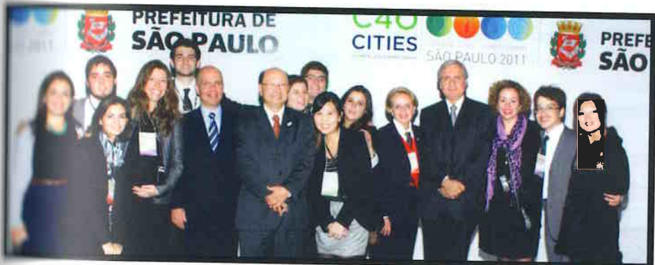
Equipe SMRI na C40 de 2011.