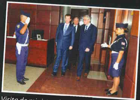
Visita de ministro de Flandres.