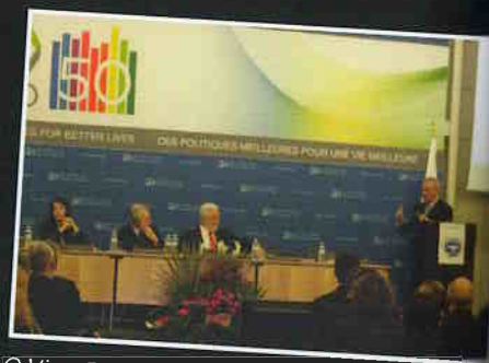
O Vice-Presidente Michel Temer fala ao BIE.