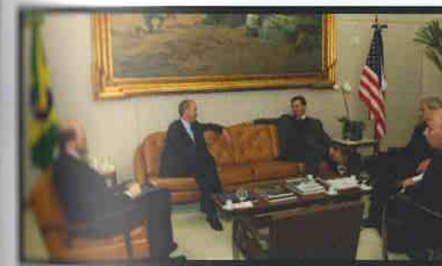
Prefeito recebe o Cônsul-Geral dos EUA.