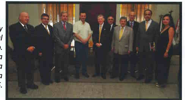
Delegação do Rotary Club Internacional visita o Prefeito. São Paulo seria escolhida para sede da convenção mundial da entidade em 2015.