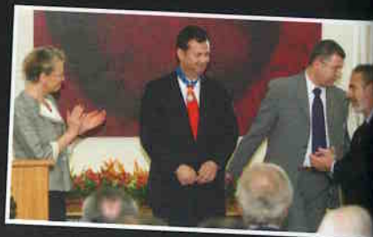
Prefeito Kassab é condecorado pelo governo da França.