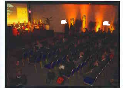
Conferência sobre o Brasil no MIPIM 2010.