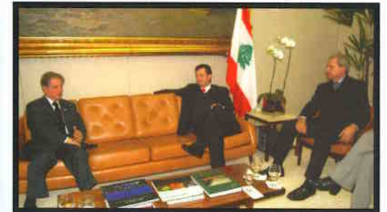
Com o ex-presidente do Líbano.