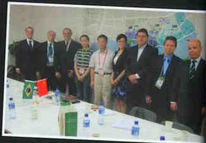
Reunião com a organização da Expo Xangai.