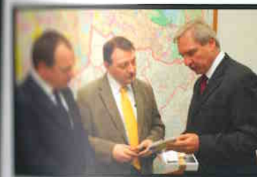
Secretário Cotait, em troca de lembranças com delegação da Wroclawskopolska.