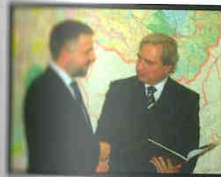
Cotait recebe ministro da Polónia.