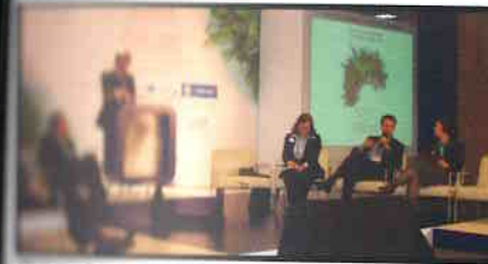
Primeira missão: Kassab discursa na conferência da OCDE, em Madri.