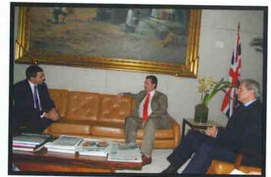
Visita do embaixador do Reino Unido.