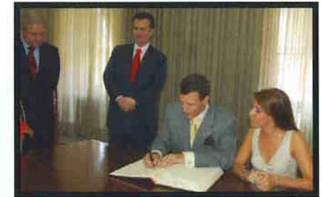
Príncipes da Dinamarca deixam mensagem no livro de visitas, no gabinete do Prefeito.