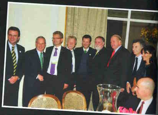
Prefeitos na abertura do C40 em São Paulo.