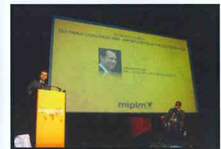
O Prefeito discursa na abertura do MIPIM 2011.