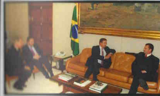
Recepção ao embaixador da República Tcheca.