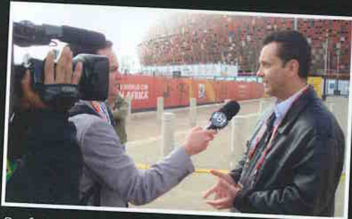
Prefeito em visita às estruturas da Copa do Mundo 2010, na África do Sul.